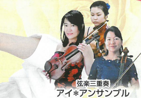
弦楽三重奏 アイ*アンサンブル

代表曲「亜麻色の髪の乙女」「パピヨン-papillon」 などジャンルを超え様々な楽曲を歌いこなす歌唱力、 透明感の高い歌声が支持される。