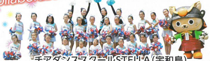
チアダンススクールSTELLA(宇和島)