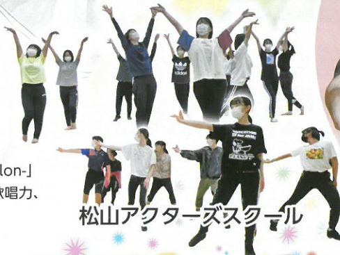
松山アクターズスクール